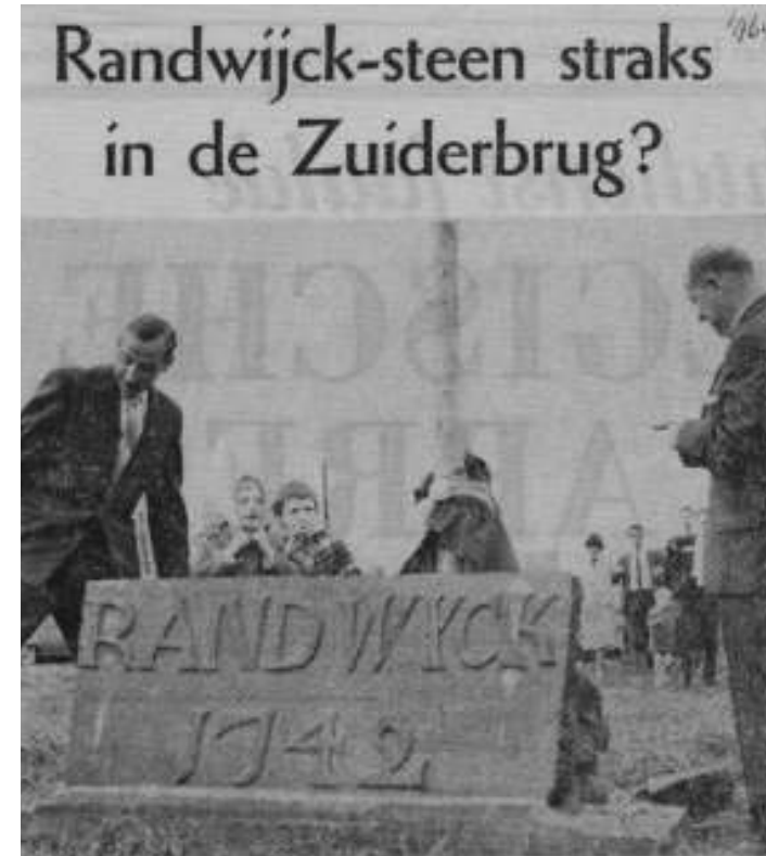
(uit de Nieuwe Limburger, 1964)

Van beide kwam niets terecht en tot verontwaardiging van WSVRandwyck werd de steen uiteindelijk bij de opening van het gouvernement in 1986 kado gedaan aan de provincie. Jaren van protest en overleg leken niets uit te halen, maar het 'gerammel' aan de poorten van het provinciehuis had in 2009 dan eindelijk succes. De oorspronkelijke steen kregen ze dan wel niet terug, maar in opdracht van de provincie heeft beeldhouwer Tycho Flore een replica gemaakt die nu (weer) staat opgesteld bij de vlaggenmast op het terrein van WSVRandwyck aan de Lage Weerd 10.