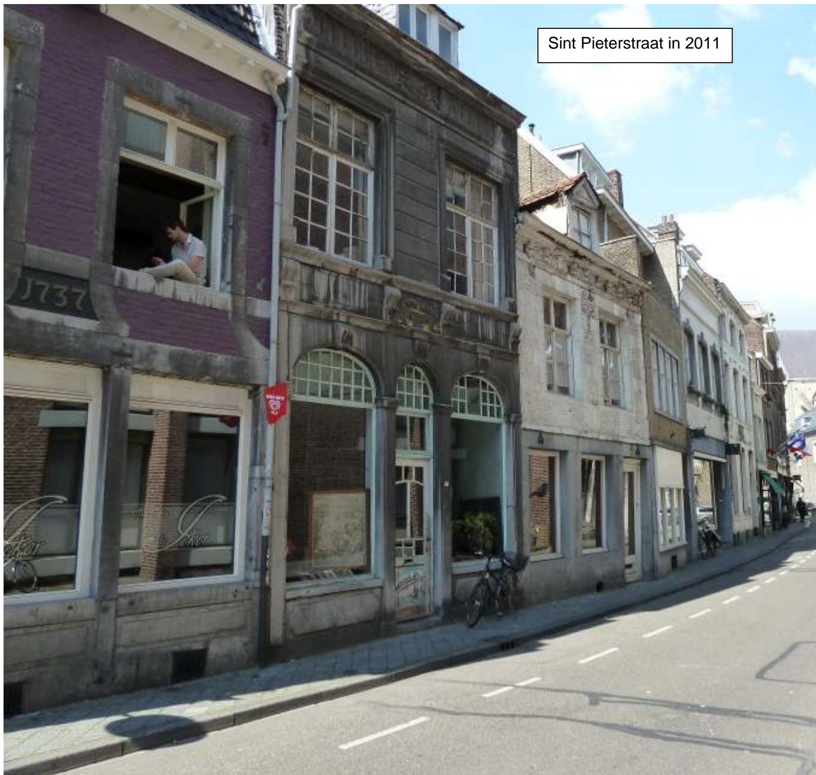
Sint Pieterstraat in 2011