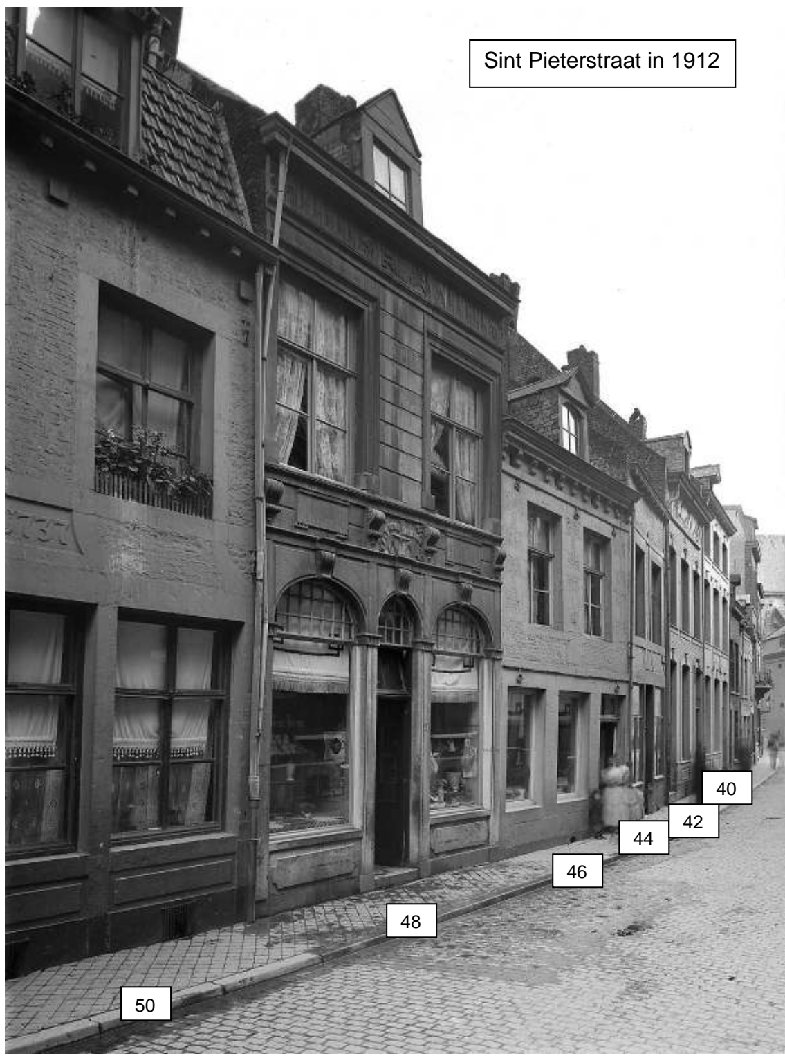
Sint Pieterstraat in 1912