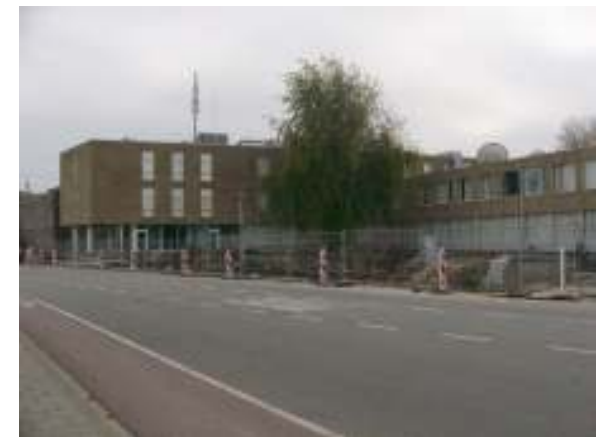
2010: ook op de schop

X = de plek waar het nieuwe appartementencomplex verrijst Y = café INT GROEN HERT