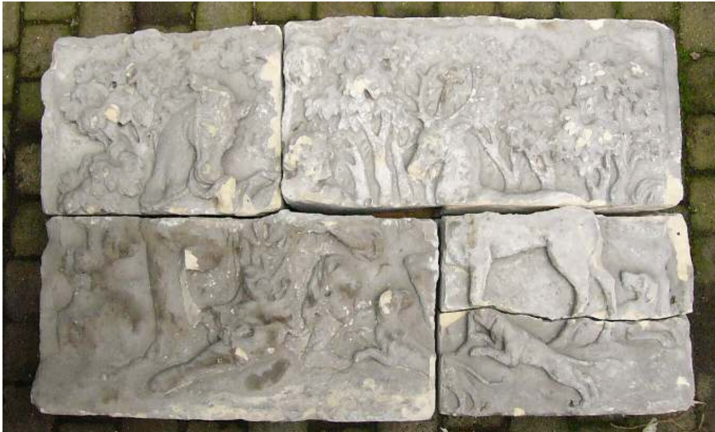
St. Hubertussteen uit 1655. Afkomstig van O.L. Vrouweplein 25.

Het nieuwe 'Museum Maastricht' kan dus op de VMG rekenen.