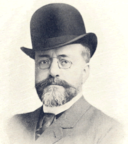
Victor de Stuers