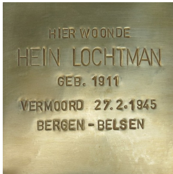
Struikelsteentje geplaatst 21-10-2013