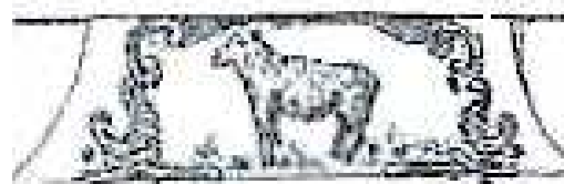
Gepland: herstel of nieuw staand schaap naar oud model