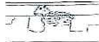
Het originele schaap, beschadigd na de vorige gevelaanpassing