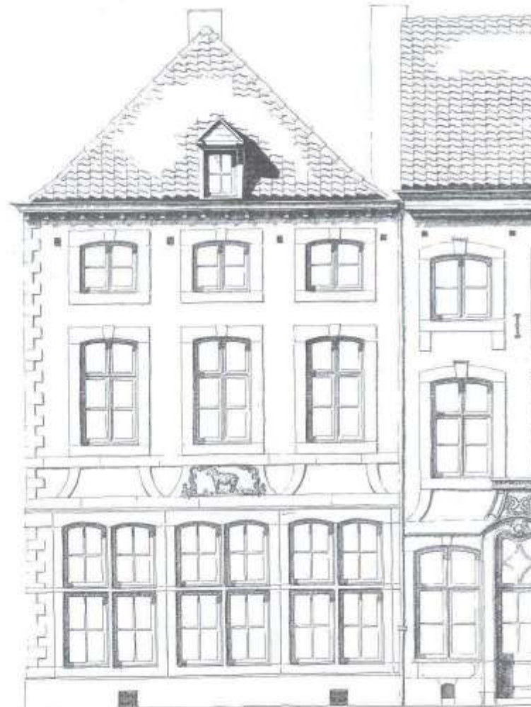
Kersenmarkt 10 wat het moest worden ná de verbouwing

Deel zijgevel van Kersenmarkt 10 om de hoek Achter het Vleeshuis. Onbekend is of de muurschildering van St. Martinus er toen al was of nieuw werd gerealiseerd en later weer verwijderd.