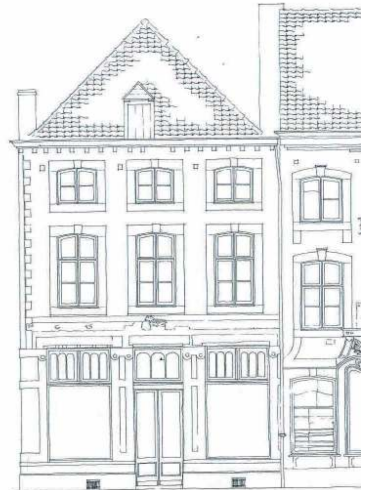
vernield schaap vóór de verbouwing